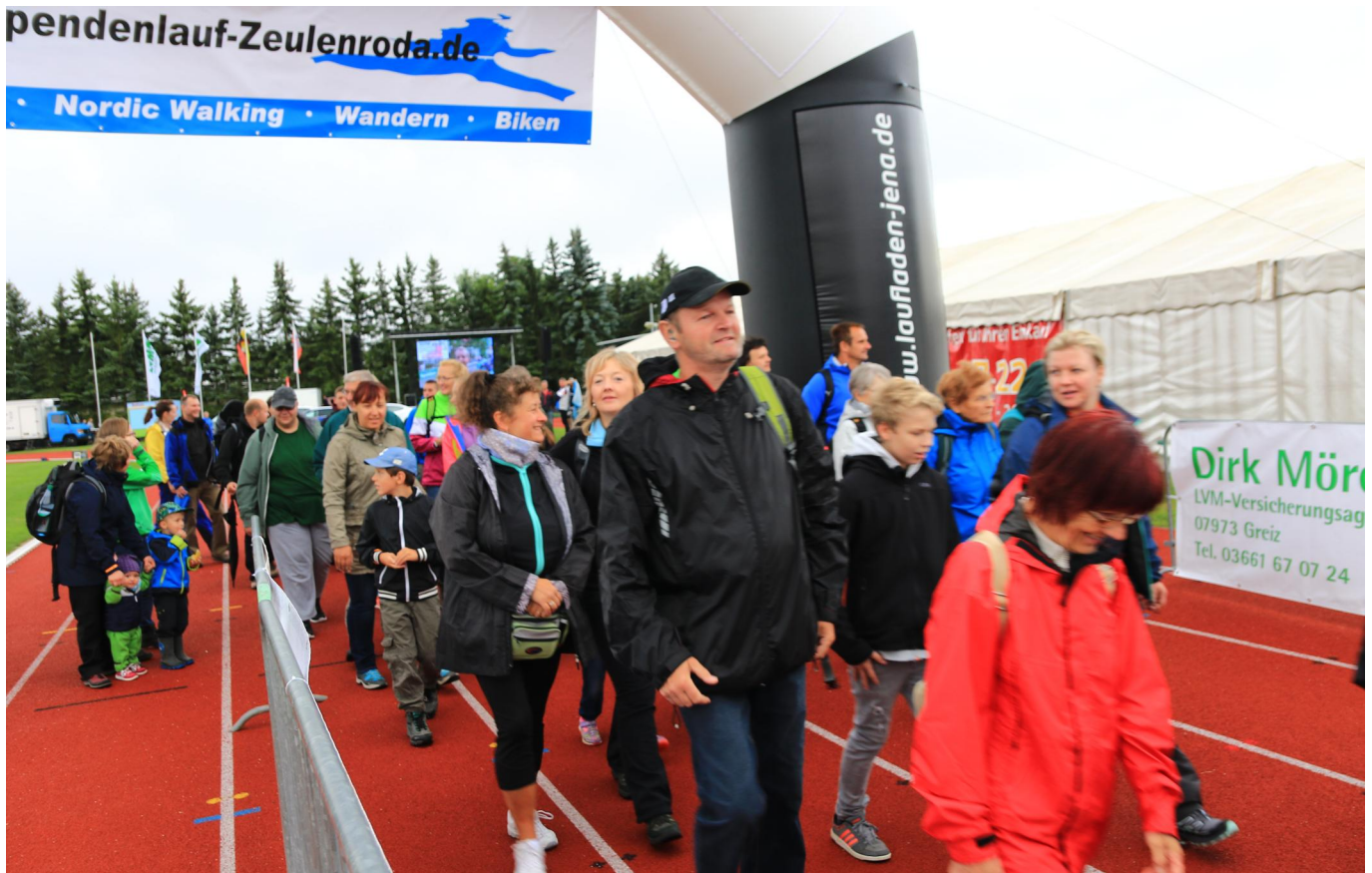
es geht los