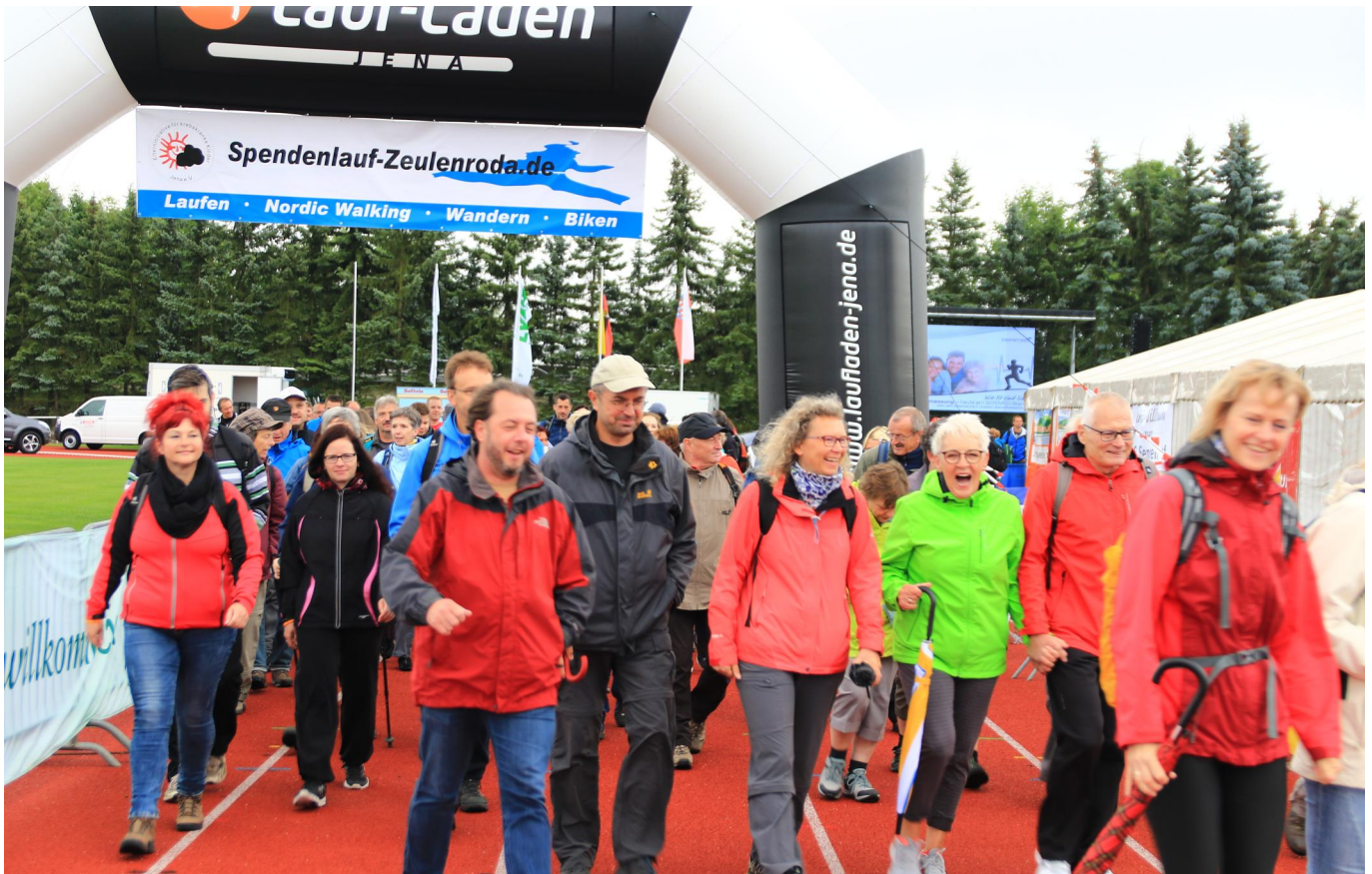
mit guter Laune auf die Strecke