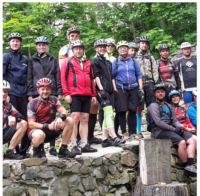
Gruppenbild muss sein