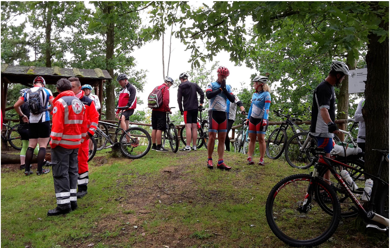
Pause am schönen Blick