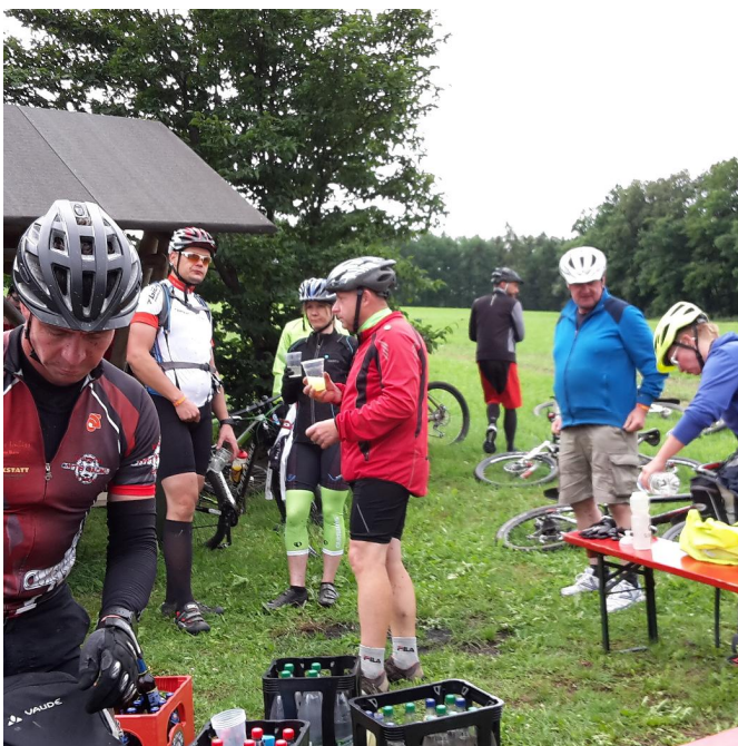
Rad fahren macht durstig!